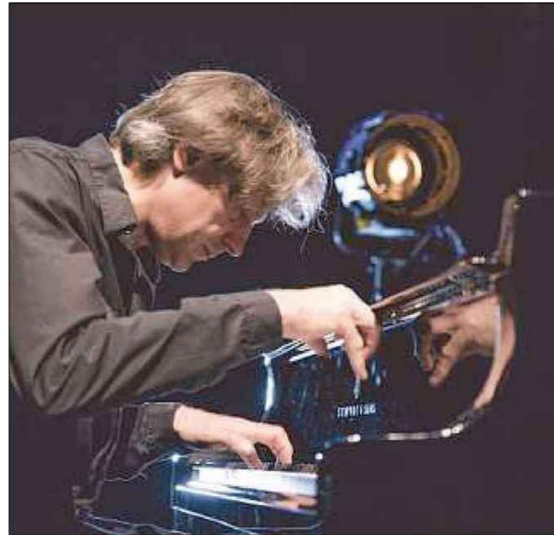
Le pianiste Dimitri Naïditch, le bonheur entre jazz et classique.

Dans la musique classique, l'histoire a gardé un répertoire formidable qui est écrit, codifié en quelque sorte. Chaque note, chaque intention, chaque phrase y est mûrement réfléchi, pensée et ne laisse qu'une