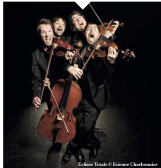
Eclipse Totale

15 & 16 déc 20h, Théâtre National de Nice. Rens : trn.fr