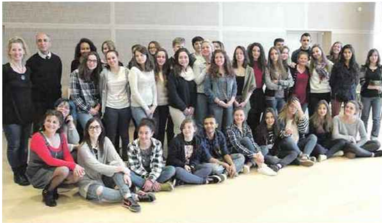
Les élèves se préparent pour ce grand rendez-vous.

Pour la danse, la Compagnie Humaine à Nice avec le chorégraphe Éric Oberdorff a été mis à contribution. Au total, ce sont une trentaine d'élèves (quinze chanteurs et quinze danseurs) qui