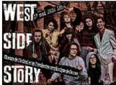
L'affiche du concert ce mardi 17 mai à 18 heures avec dans le rôle des Sharks et Jets, des élèves de l'établissement grassois.

Un rendez-vous ultra-professionnel puisque les chanteurs se sont entraînés depuis janvier dernier et répéteront avec l'orchestre lors d'une générale prévue ce lundi de Pentecôte dans la salle de répétition cannoise de l'or-