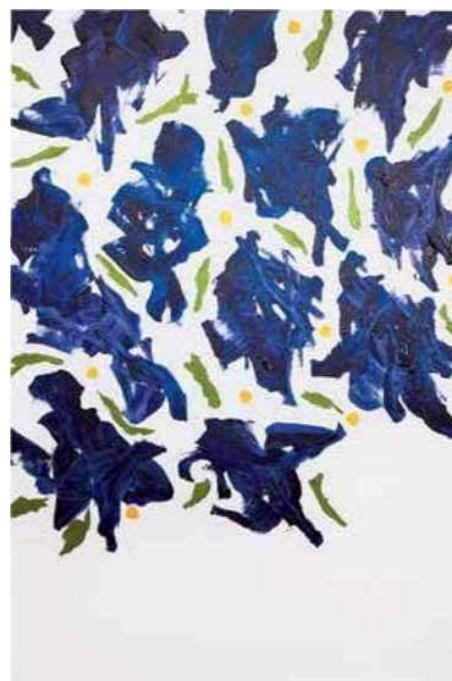
Jacques Martinez «1, toile acrylique et techniques mixtes, 130x195 cm