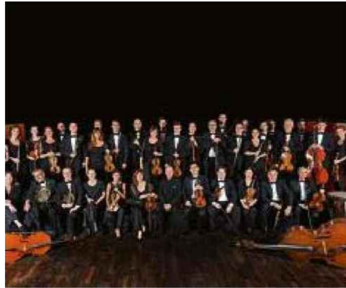
Le projet de l'Orchestre régional de Cannes Paca, pour la diffusion de la musique classique auprès du jeune public, est l'un de ceux retenus par le conseil d'administration du fonds.

contribuer à « souder la communauté cannoise » car, si la ville compte deux fois plus d'assujettis à l'impôt sur la fortune que la moyenne nationale, elle compte également un pourcentage inférieur de foyers payant l'impôt sur le revenu. L'ambition de la municipalité est aussi de convier à cet élan de solidarité vers les résidents étrangers, nombreux sur la ville. Plusieurs ont déjà été séduits par l'initiative, en particulier dans la communauté anglo-saxonne qui s'est mobilisée à travers le réseau de blogueurs « I Love Cannes ». « Le fonds de dotation Cannes permet de renouer avec une tradition locale qui s'était développée au XIX e siècle et dans la première moitié du XX e , avec les bals de charité ou la multiplication des œuvres de bienfaisance, grâce au soutien de célébrités et résidents étrangers et autochtones », analyse le maire de Cannes. Selon lui, la prochaine étape sera « la constitution d'une fondation Cannes capable d'offrir des réductions d'impôt aux donateurs soumis à l'impôt sur la fortune ». ■