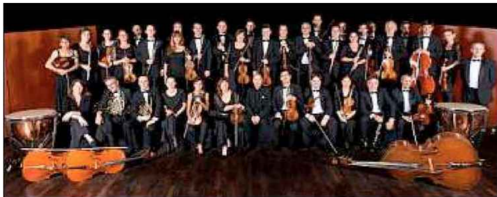
L'Orchestre régional de Cannes Provence Côte d'Azur.