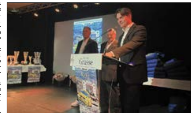
Le Rallye Fleurs et Parfums se tiendra les 5 et 6 avril prochains.

Le soutien financier de la municipalité sera alors décisif pour permettre à ce projet ambitieux d'aboutir en 1955, avec la première édition du Rallye Fleurs et Parfums. Le maire Jérôme Viaud a renouvelé « le soutien de la Municipalité aux