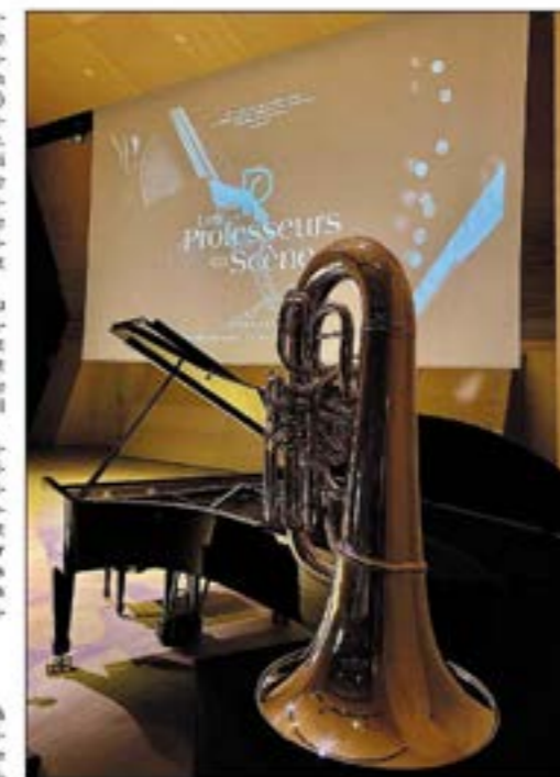
La présentation de la saison a eu lieu en l'auditorium Hector-Berlioz du conservatoire.