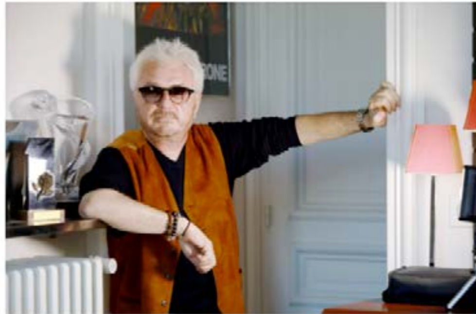
Cerrone jouera avec l'Orchestre national de Cannes à Nice.