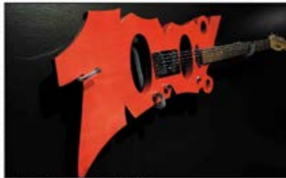
Musique, arts plastiques, arts vivants...

Soixante-cinq projets artistiques et cul-