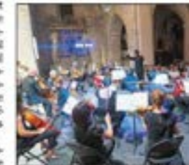
L'Orchestre national de Cannes entame une saison riche en événements sous la direction de Benjamin Lévy.

Ce cycle de mélodies écrites en 1909 d'après des poèmes en prose extraits du recueil Les Illuminations d'Arthur Rimbaud sera agrémenté de lectures de textes et bénéficiera, selon la for-