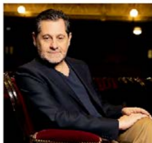
Olivier Py

Actuellement directeur du Théâtre du Châtelet, Olivier Py, dramaturge, metteur en scène, comédien et réalisateur, était, il y a à peine un an encore, directeur du Festival d'Avignon. Nous Favons rencontré.