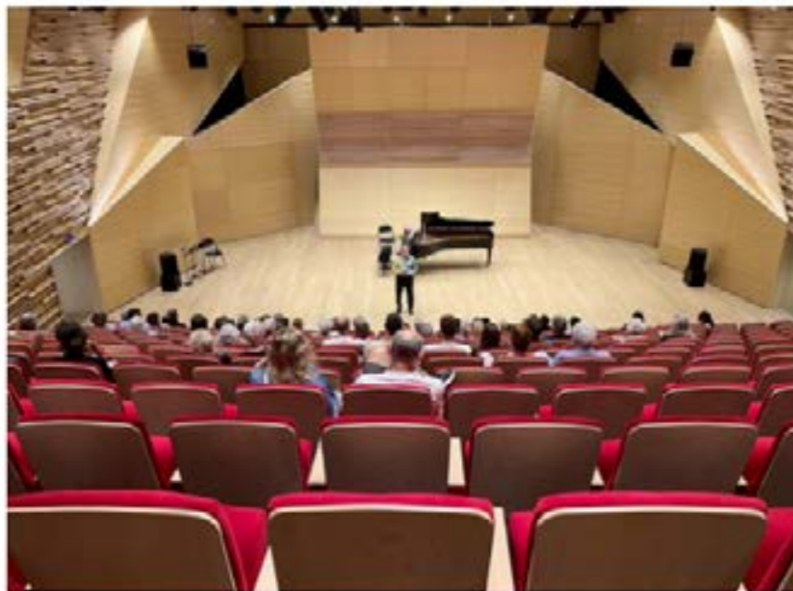
Lors des Journées européennes du patrimoine, la visite du Conservatoire a affiché complet

Sans aucun doute, c'est un programme très diversifié que chaque mélomane attend avec impatience !