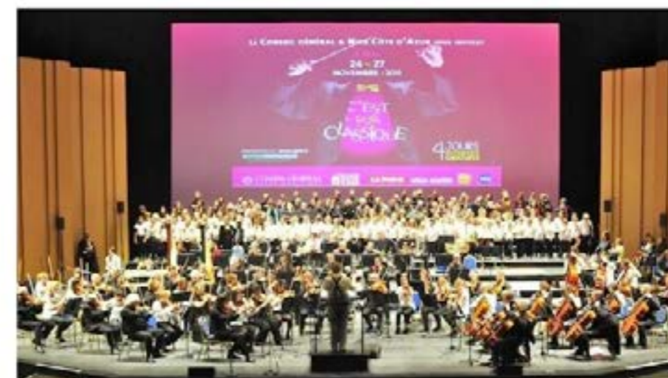
L'Orchestre Symphonique Azuréen en grande formation, lors d'un concert C'est pas classique