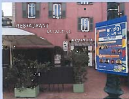
Le restaurant La Cantina accueille le Bistrot des auteurs samedi.