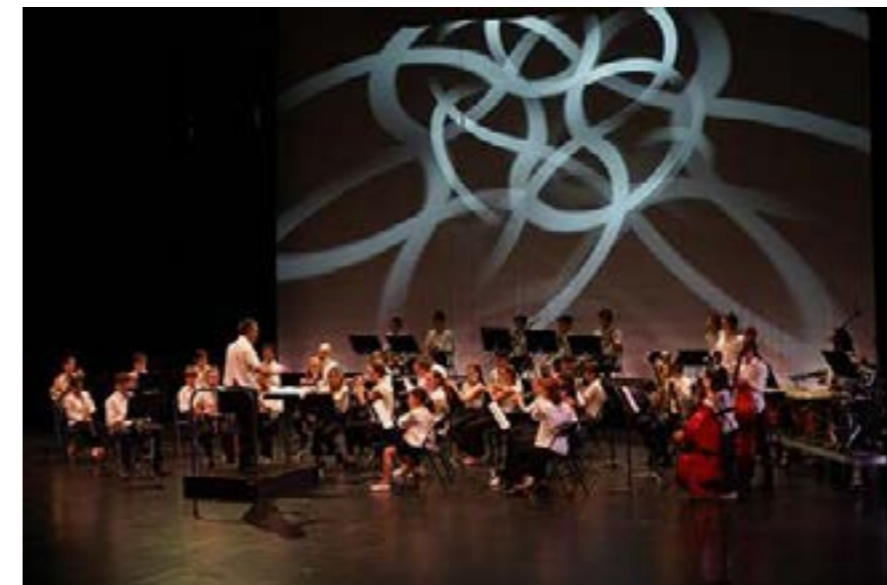
Un lieu magnifique qui va accueillir une superbe saison !

A commencer par une Carte Blanche offerte à de jeunes solistes parmi les élèves les plus motivés